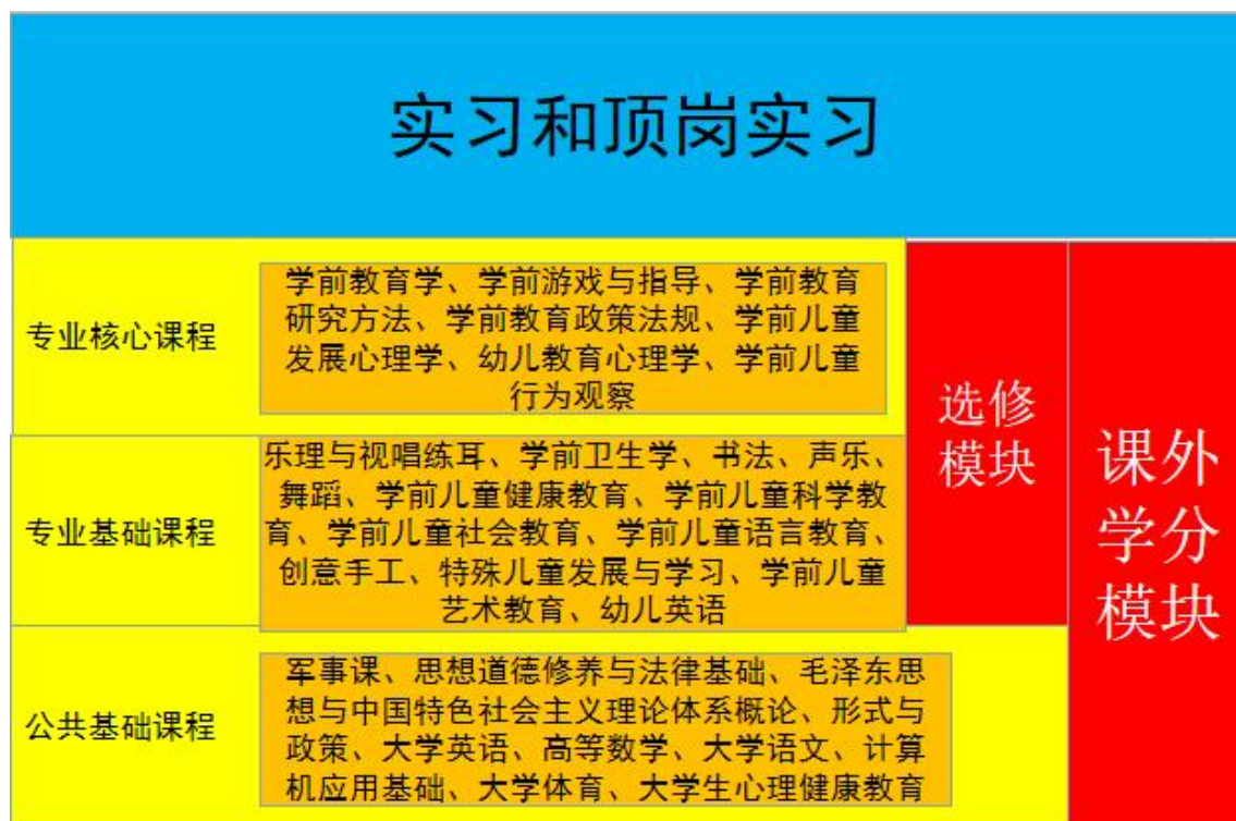
图2 婴幼儿托育服务与管理专业的课程体系