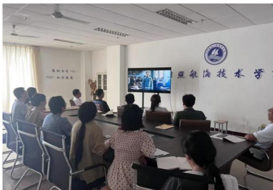
图 4 学校党总支开展党员思想政治教育活动

作于教学工作密切融合，党员干部带头，全面推进学校教学的提质增效，注重双师型教师的培养，主题教育成为教育教学高质量发展的“强引擎”。