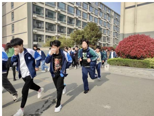
图 21 学生处组织校园消防疏散演练