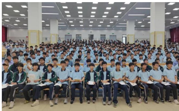
图 7 招就处组织毕业生创新创业讲座

优化就业服务措施。 学校启动了学生创业工程，开展毕业生创新创业讲座，参与人数达 730 余人次，多形式介绍国家就业创业政策，为学生创业创造良好的环境和平台。多次组织企业宣讲会，为学生搭建优质就业平台。多次举办就业服务指导讲座，邀请文旅、电商、物流、智能制造行业专业人士出席讲解，帮助学生全面了解就业情况和求职技巧，分析就业市场，规划职业发展。