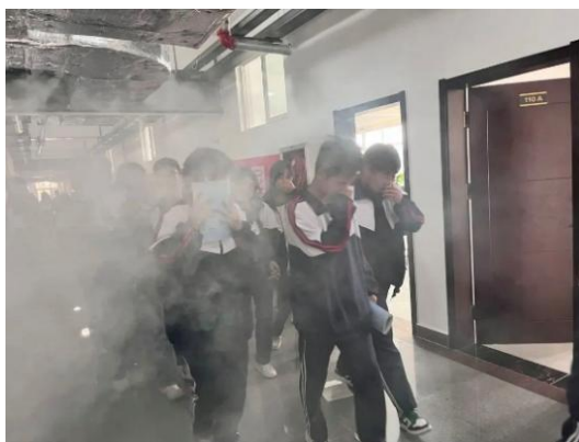
图 33 学生处开展教学楼消防应急疏散演练活动