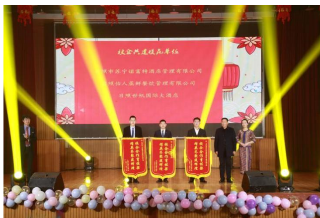
图 17 学校为校企共建模范单位颁奖

展，大多选择降低成本，同时加强质量管理服务，以满足顾客更多的个性化需求，因此，前线服务类职位最为紧缺人才，而学校恰恰补齐这一缺口。学校清晰定位基于工作过程的岗位实习的目标系统。按照行业高技能人才的要求，建立符合相应岗位群的职业目标体系，着力培养学生的综合职业素质，所培养的学生有效解决了酒店管理行业痛点。