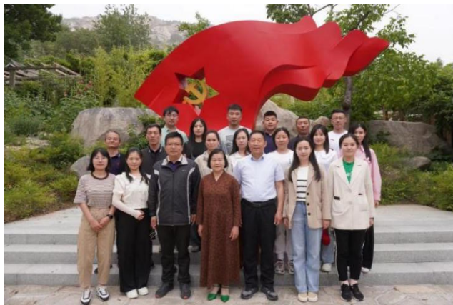
图 27 学校党员教师走进沂蒙山传承沂蒙精神

于深化沂蒙精神的学习、宣传，特别是发挥其培根铸魂、资政育人的作用具有重要价值。学校组织教师到沂蒙山唱红歌，深入了解沂蒙精神，更好的传承沂蒙精神。