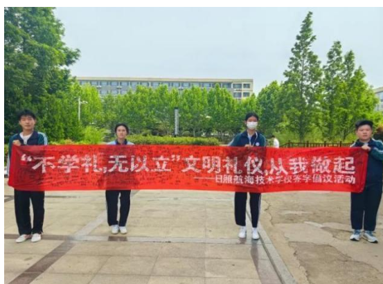
图 18 学生处开展校园文明礼仪签字活动

弘扬优秀传统美德，将立德树人落到实处。 学校开展文明校园礼仪教育活动，在活动中提高学生的道德品质和公德意识，牢记教育使命，提升育人成效。开展推广普通话校园演讲活动，让普通话与素质同在，与形象同伴，与文明同行，为全体师生营造良好的普通话学习环境，服务筑牢中华民族共同体意识，为中华优秀传统文化的传播贡献力量。