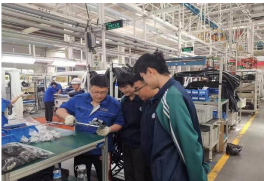
图 25 学校开展汽车运用与维修专业企业进课堂活动