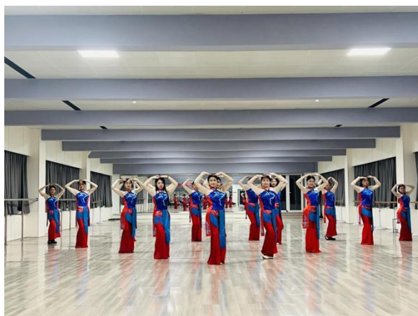
图 30 舞蹈《心有翎兮》排练现场

厚植家国情怀，涵养进取品格。全面展现新时代青少年学生树立远大志向、培育美好心灵、朝气蓬勃、奋发进取的精神风貌，遵循时代特征、校园特色、教育特质和学生特点，营造向真、向善、向美、向上的文化氛围。