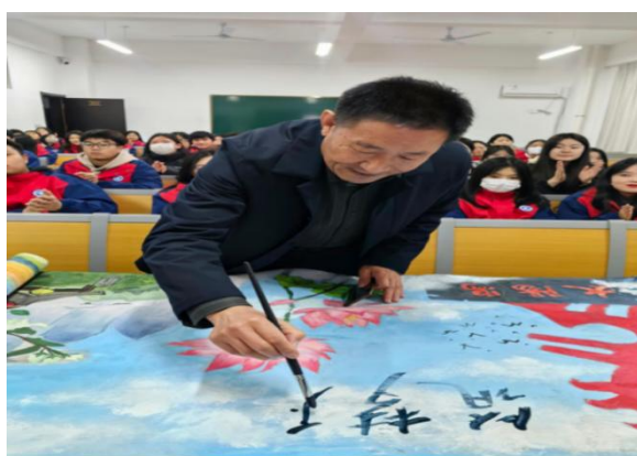
图 29 学校校长为绘画比赛获奖学生作品题字

开展各种课内外活动，搭建个性发展平台。 学校充分广泛地开展各种课内外活动，为全面培养学生个性特长搭建起发展平台。如创建安全文明校园、树立社会主义荣辱观、珍爱生命，拒绝毒品、拒绝管制刀具进校园、节约从我做起、做一个文明的学生等专题活动，既进行了思想品德教育，又丰富校园文化生活，开拓了同学们的视野。