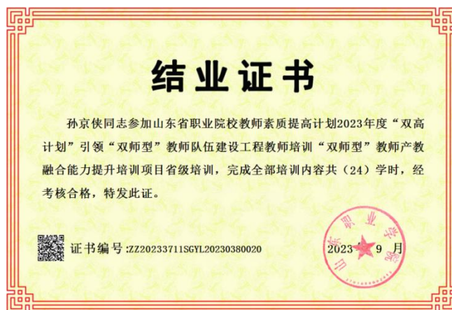
图 16 学校教师参加“双师型”教师培训取得结业证书