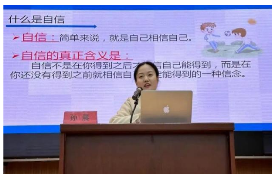
图 23 学生处开展心理健康讲座