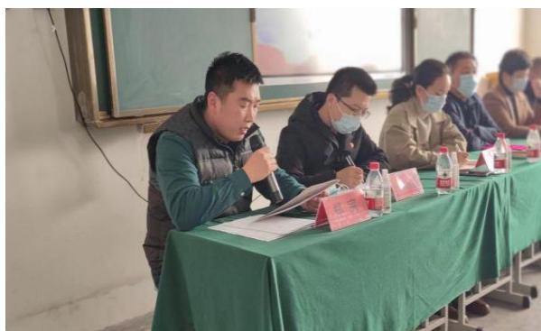
图 8 招就处组织就业服务指导讲座

重视困难学生就业工作。 学校 2023 届毕业生共计 1040 人，根据学校招生就业处前期梳理，共分出城镇特困职工家庭毕业生、城乡最低生活保障家庭毕业生、偏远地区生源毕业生等多类困难学生。针对以上学生开展就业援助工作，优先做好就业指导，帮助困难毕业生端正就业观念，调