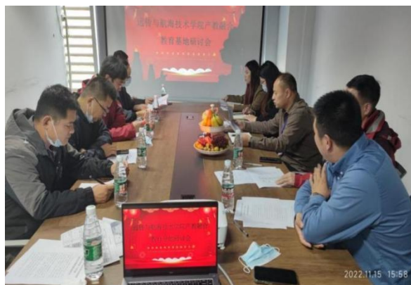
图 12 学校联合校企合作单位召开成立产教融合教育基地研讨会

“紧密型”合作是学校和企业部门紧密结合成一个实体，形成一种密切的合作关系。常见的形式如合作共建人才培养基地，合作共建研发中心等。学校通过合作共建人才培养基地或合作办学的方式，让企业直接参与到人才培养过程中来，参照职业标准，与学校一起制定人才培养方案。“校企合作研发中心”作为学生实践科研的一个平台，使学生在校期间就能把自身的学习与行业发展结合起来，了解前沿技术，掌握行业动态，规划自己的学习方向。在就业时就能迅速的与企业需求融合，在竞岗中获得有利位置。企业专家与教师合作开发课程标准和教材，并结合职业能力要求，以典型工作任务为载体，设计实训项目和学习情景。通过将学校的办学方向与行业的需要紧密结合，使学生在校期间就能接触到行业领先技术。