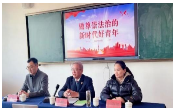
图 31 法治副校长来校开展法制讲座

培养学生自我教育、自我管理、自我服务能力。 在教育工作中，学校注重学生的自主管理。如每届学生会、校卫队、舍务管理、团委干部都是通过公开选拔，竞选产生出来。学生会的各职能部门都参与学校的学生行为规范、舍务管理、卫生、校园安全的管理之中。在德育工作学生会发挥了出色的作用。