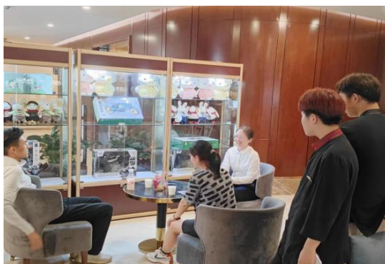
图 6 教师走访合作企业探讨共同打造“双创”实践平台

双元化平台建设，推进理实深度融合。 整合学校和企业资源，建立学生创新创业教育实践基地，着力打造“双创”实践平台，校内实践平台——能够提供教育培训、实践指导、政策咨询，与地方政府、企业、创业大街、信息产业园深度合作建立的校外双创实践平台，为学生提供全要素、开放性、低成本、便利化的“双创”支撑服务。学校各专业群和就业创业类社团，开展企业家讲座、创业公开课、生存挑战赛等丰富的“双创”活动，推进了理论学习与双创实践的深度融合。