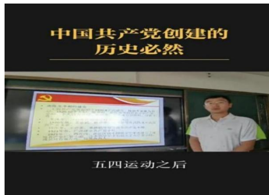
图 2 航海系党支部开展党员讲党课系列活动

联学共建促融合，党建携手聚合力。 一是组织总支书记、支部书记、党员讲党课活动，以此全面加强对党员干部的理想信念教育、党性宗旨教育、党规党纪教育、党风廉政教育、科学文化和业务知识教育。二是以支部为单位，线下学习为主，线上学习为辅，确保党员学习教育全覆盖。线上学习依托“学习强国”等平台，实现主动学、时时学、处处学。