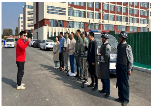
图 34 学校组织反恐防暴应急演练