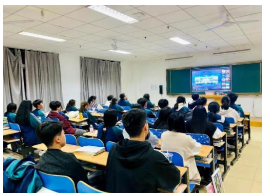
图 22 学生观看日照市青少年禁毒知识竞赛直播

关爱学生心灵，护航学生快乐成长。 根据学校 2023 年安全工作计划要求，学校开展了题为“相信自己，拥抱幸福”的心理健康知识讲座，进一步普及心理健康知识，营造了良好的心理健康教育氛围。在日常生活中，开展心理咨询服务，为学生解决心理困惑，了解学生情绪状态和生活近况。在疫情期间，开展“穿越寒冬温暖你”为主题的学生干部座谈会。倾听学生心声，了解学生他们的困难和诉求，排查安全隐患。让学生能够在校感受到如家般的温暖、父母般的呵护，减轻思想压力。