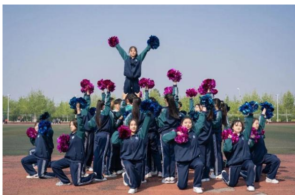
图 19 学校举办春季运动会

园春季运动会，在活动中增强学生体魄，展现学生风采。开展校园篮球赛，在活动中增强团体协作意识和集体荣誉感，展示了学校学生团结、和谐、勇于拼搏的精神风貌。此外，学校响应全民健身战略的号召，积极参与日照市第十三届全民健身运动会，在舞蹈项目比赛中荣获优秀组织奖、拉丁舞担任单项伦巴一组第一名、成人拉丁舞单人组第二、三名的好成绩。