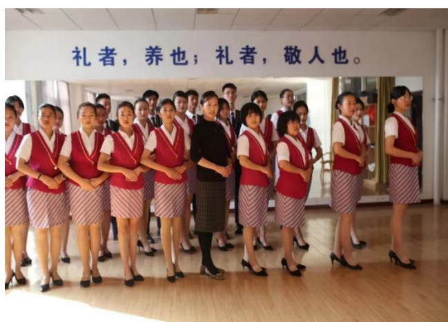
图 11 礼仪教师教授同学们岗前礼仪

完善内部管理与校企合作工作的配套制度。 建立完善的企业管理与学校合作的配套制度，学生在校期间就可以提前适应企业工作氛围，同时遵循校内纪律，有利于学校工作的开展。建立与专业相适应的科研项目开发、校外实践基地管理、顶岗实习、师资培养等制度体系。规范学校实习管理规定，结合企业管理手册，共同做好实习生的实习管理工作，确保学生在实习期间不出安全问题。