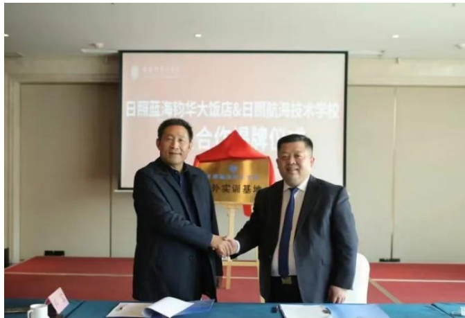
图 13 学校举行蓝海钧华大酒店校外实训基地揭牌仪式

深化产教融合、校企合作是保障职业教育高质量发展的关键举措。日照航海技术学校与日照蓝海钧华大酒店校企合作实训基地揭牌，这是学校和蓝海大酒店实施多元办学、深化产教融合的重要举措，下一步双方将在技能大赛、人才培养、实习就业等方面深化合作，将职业教育产教融合落到实处，为当地经济和社会发展做出更大的贡献。