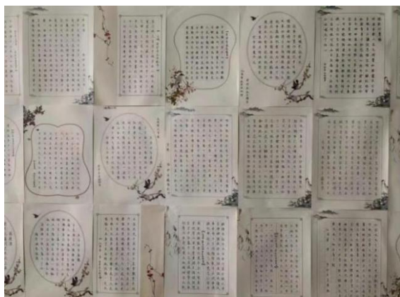
图 28 管理系“以笔敬华夏 书画趁年华”书法比赛学生作品