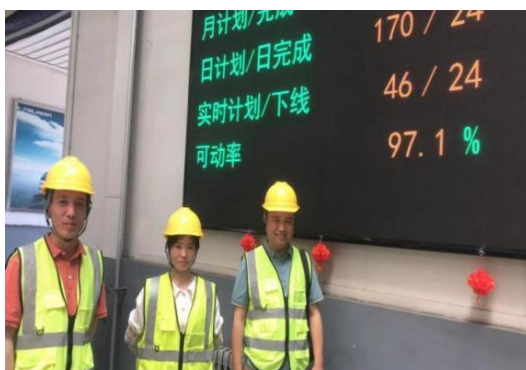
图 26 汽车运用与维修专业教师走进福田汽车开展调研