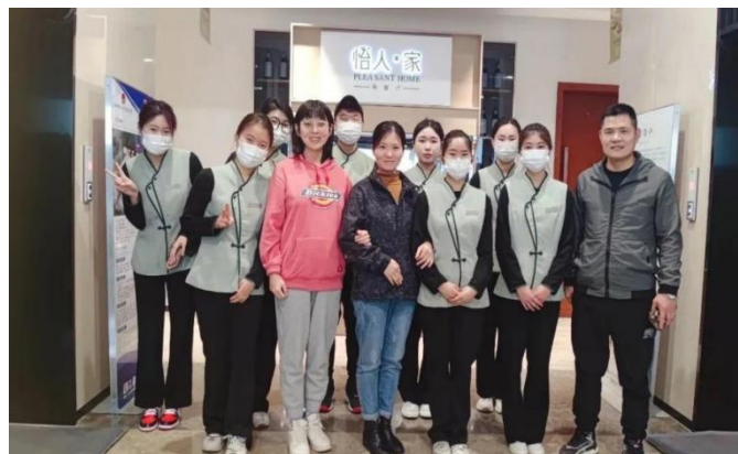
图 14 实习指导教师走访怡人家茶餐厅

为深入贯彻党的二十大精神，传承劳动精神、工匠精神，了解学生的顶岗实习情况，加强学生实习管理，提高人才培养质量，在五一劳动节假期，日照航海技术学校招就办携手各系部老师开展访企拓岗慰问活动，并与企业领导和学生进行了座谈交流。