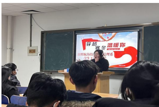
图 24 学生处组织“穿越寒冬温暖你”座谈会