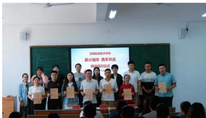
图 10 教务处组织开展师徒结对启动仪式

校企联合培养，提高教师专业技能水平。 学校每年春季学期安排教师到企业实践，完成 3-6 个月的实践工作。此项措施，不仅有利于提升教师专业技能水平和提高学校“双师型”教师比例，而且对于提升学校专业建设水平起到一定的推动作用。通过教师到企业实践，教师可以学习企业先进经验与技能，学校将进一步加强与企业间的联系，为进一步推动校企合作，产教融合起到重要作用。