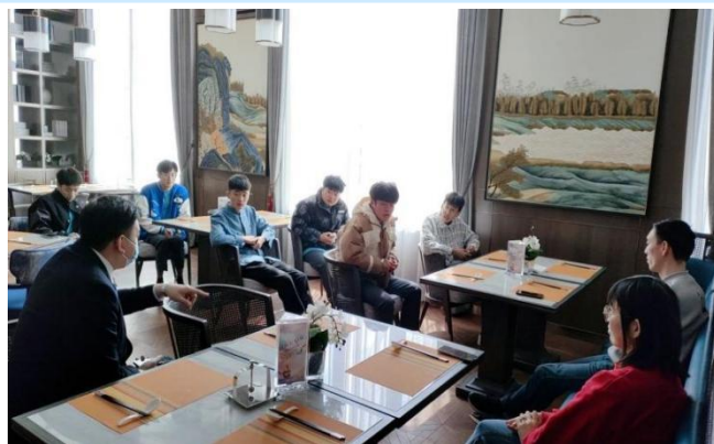
图 15 实习指导教师走访东湖开元名都大酒店

在走访过程中，通过座谈会、实习岗位看望等形式，各指导老师与同学们进行了热情交流与座谈。同学们对学校领导和老师的到来感到分外喜悦与激动，详细汇报了实习以来获得的成长和取得的成绩，同时也分析了遇到的困难和困惑，老师们认真听取并详细记录了每一位学生的所学所感、肯定了大家取得的进步，同时也对同学们提出了希望和要求：一是希望同学们在岗位实习期间服从管理，珍惜岗位实践学习机会；二是希望大家在日常工作、生活中要注重人际交往，增强克服困难的勇气，不断提升自身的专业素养和职业能力；三是提醒大家注意安全（生产安全、交通安全、人身安全、防溺水、预防电信诈骗等）；四是在实习过程中，如遇情况和问题及时与班主任或招就办反馈，共同完成学校规定的顶岗实习教学计划。