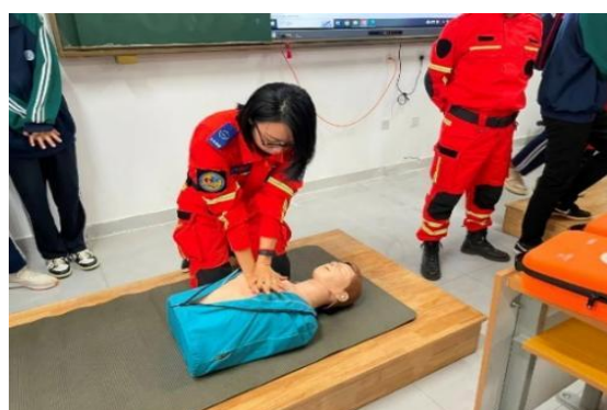
图 32 日照方舟救援队到校开展安全应急讲座

加强安全教育，建设平安校园。 在安全教育工作中，我们把安全“安全责任，重于泰山”放在德育工作中，重点来抓。通过各类安全主题活动中，学生参与体验、自我感受、利用座谈会、安全知识演练，用事实唤醒学生安全意识和自我保护意识。让学生了解人身安全，财产安全、防火、防盗、用电安全常识，建立反恐防暴、寝室逃生、教学楼逃生的预案和自我自救的方法。建立责任到位的管理机制，同时加强校内的各项巡视和值班工作，确保校园安全。