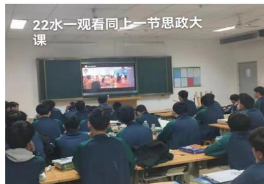
图 3 学生处组织开展学生思想政治教育活动

初心不改强党性，砥砺前行新动力。 学校党总支在王书记的带领下，巩固拓展主题教育学习活动，为奋力新征程凝心聚力。将党建的思想工