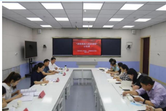
图 5 学校教师代表参加公办民办学校思政育人协同共建活动

为学习贯彻新职教法，落实立德树人根本任务，推进“三全育人”，积极依托全市“公办民办思政教育协同育人共建平台”，探索打造“公办民办协同育人、课程思政与思政课程同向同行、思政教育与专业教育同频共振”的“大思政”格局，5月31日，学校部分教师代表参加我市“课程思政与思政课程示范课”活动。