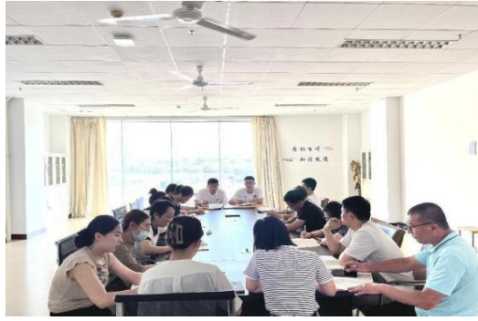
图 1 学校开展党员“三会一课”

联学共建促融合，党建携手聚合力。 一是组织总支书记、支部书记、党员讲党课活动，以此全面加强对党员干部的理想信念教育、党性宗旨教育、党规党纪教育、党风廉政教育、科学文化和业务知识教育。二是以支部为单位，线下学习为主，线上学习为辅，确保党员学习教育全覆盖。线上学习依托“学习强国”等平台，实现主动学、时时学、处处学。