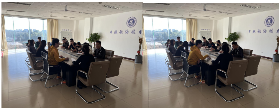
图 5：国家助学金评选