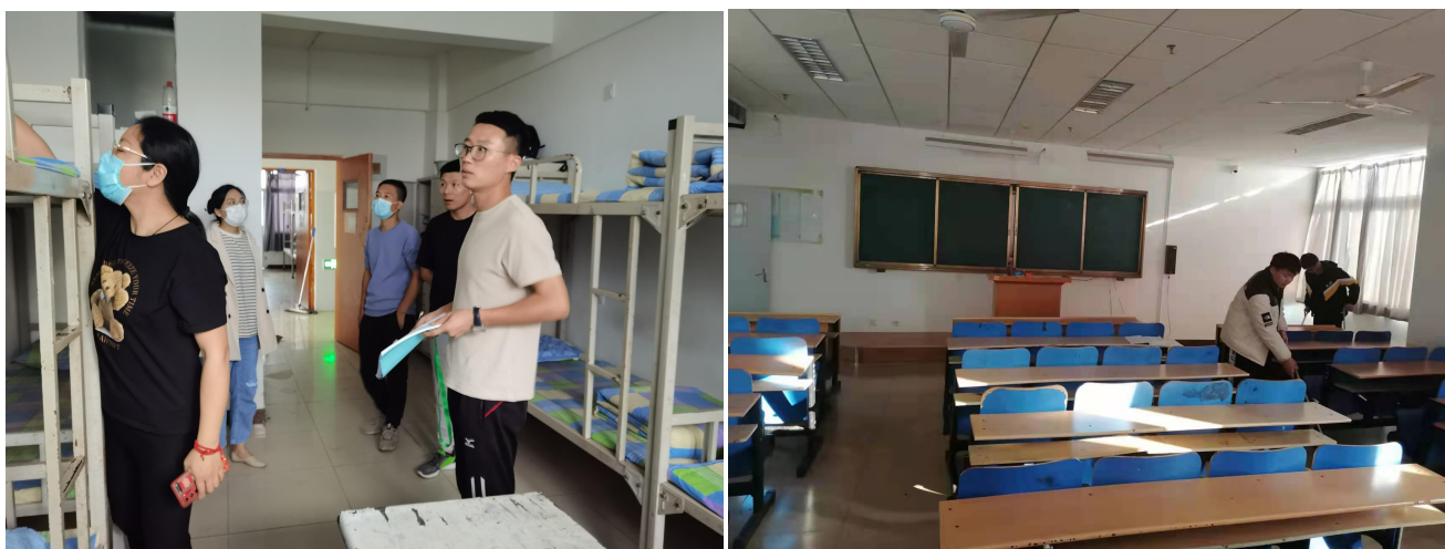
图 2：学生宿舍及教室卫生检查

根据学校总体要求，结合学生管理工作实际情况，统筹部署每周工作重点。每天进行宿舍及教室卫生检查并实时通报，每晚汇总上报值班情况，不定期抽查违禁物品及违纪现象，督促管理和教学秩序。加强学校学生管理工作督导，充分发挥学生处的宏观指导、督查、服务职能，以促进各系部学生管理工作规范化。