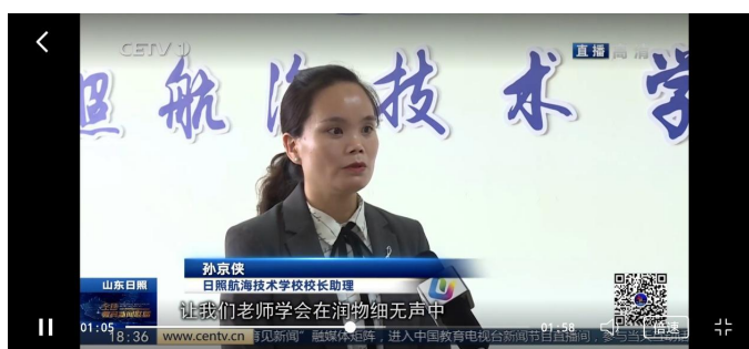
图4：教务处领导接受关于思政育人课程的采访

为落实《日照市教育局关于在全市公办民办中小学开展思政育人协同共建行动的通知》精神，进一步规范办学行为，推动形成全环境育人新格局，学校与日照市机电工程学校建立了帮扶结对，协同共建活动。截至目前，活动已开展两次，分别为思政课程、课程思政协同育人活动。学校积极向日照市机电工程学校学习，通过帮扶活动，提升日照航海技术学校的思政育人水平。接下来，学校将以思政课为契机，辐射其他学科，扩展到党建引领、师资培养、文化建设、校园活动等方面。