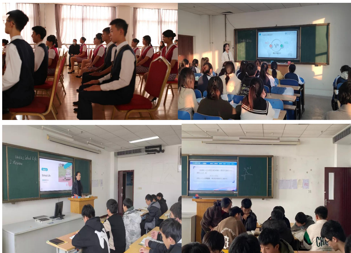
图9：示范课教学精彩瞬间

2022年春季学期以后，航校新进教师16人。整体师资队伍年轻，教学经验欠缺，给航校的教学提出了新的挑战。为进一步提升航校教学水平，落实国家关于思政教学的政策，航校教务处组织骨干教师进行了示范课活动。活动过后，青年教师普遍反映，通过示范课，为自己将来的教学指明了方向，并在全校掀起了“人人能上公开课”的教学竞赛活动。