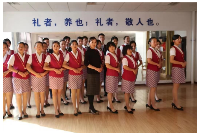
图9：礼仪教师教授同学们岗前礼仪