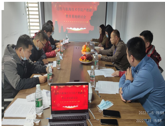
图10：航校与远传关于成立产教融合教育基地研讨会

1.在常规的校企合作基础上，还要拓宽校企合作的渠道。与多个企业在专业建设、实践教学、师资培养、员工培训、技术研发等方面开展多途径合作。多派遣专业教师到企业实践，专业教师通过实践了解企业对员工的要求，不断提高教学能力，并将自己在企业所学运用到教学中，将“要学生学”的状态变为“学生要学”。