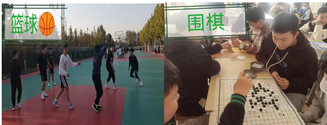
图11：特色课上课图片