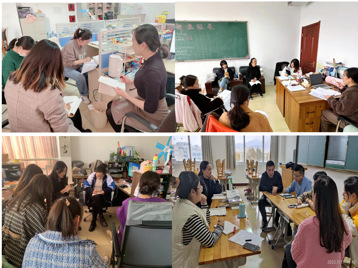
图8：教研室关于教学质量改进的会议研究

定，学校重新调整（增设）了7个教研室，推进教研室常规管理，每周二下午定期开展教研活动，加强教学团队建设，深化专业建设和课程建设，强化实践教学环节，不断提高人才培养质量。