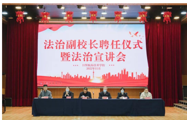
图6：学校开展法制教育主题宣传活动

通过开展法制宣传系列活动，不但在广大师生中掀起了学法、守法的法治宣传热潮，而且进一步增强了全体教职工的法治意识和权利意识，普及法律知识，提高依法执教能力，促进依法治校依法治教的进程，今后我们将认真总结经验，以新的姿态，新的措施开展明年的普法工作。